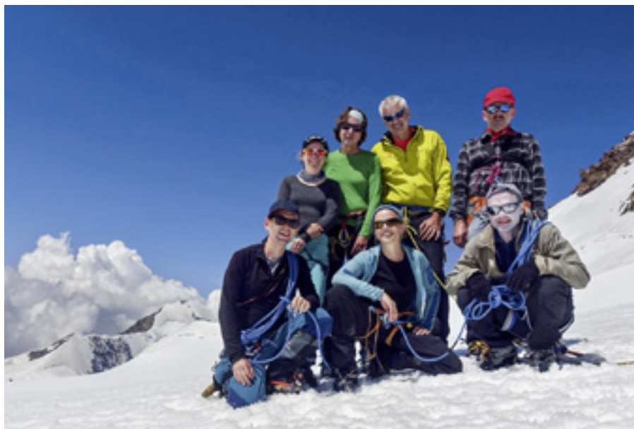
Zufriedene Gesichter der zwei Seilschaften am Colle Gnifetti 4452 m.