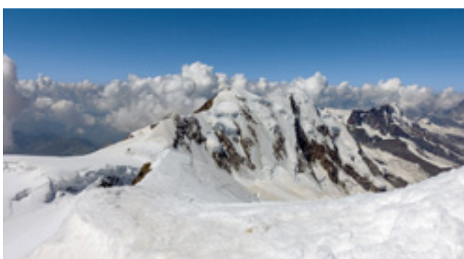
Blick von der Zumsteinspitze zum Liskamm (4527 m und 4479 m) mit Nordflanke, genannt Waschbrett.