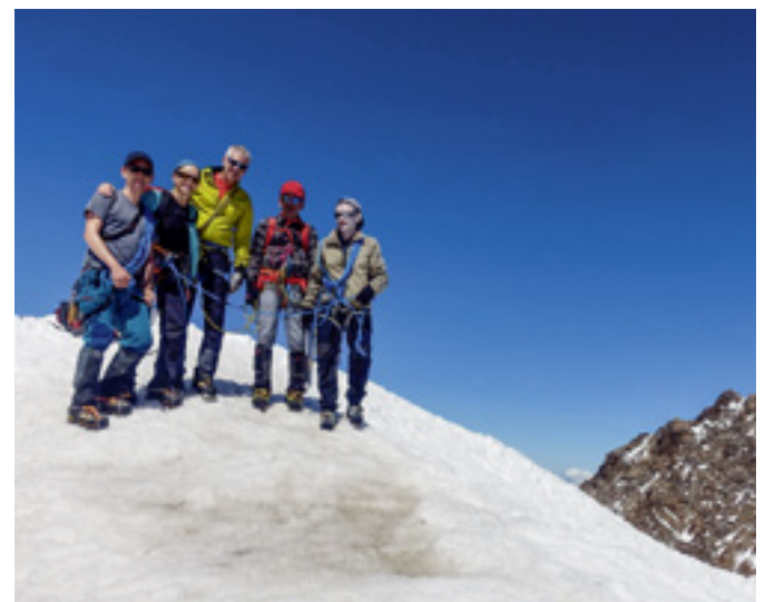
Auf dem Gipfel der Zumsteinspitze 4563 m, unserem höchsten bestiegenen Berg. Rechts Felsen der Dunantspitze 4634 m (früher Dufourspitze).