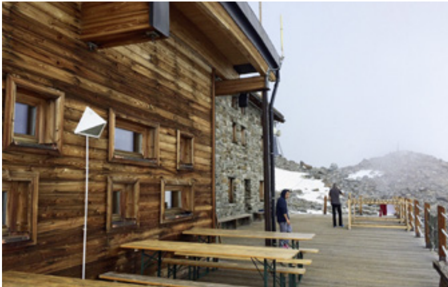
Unser Base Camp, das Rifugio Mantova auf 3500 m.

Hochtouren Spaghetti-Gipfel light vom 23. bis 27. Juli 2019.