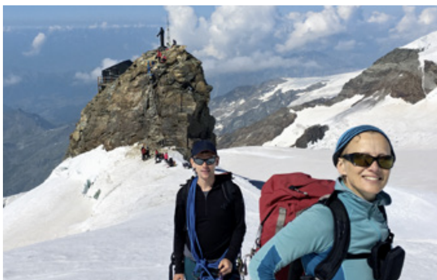
Weiteranstieg bei angenehmer Temperatur.