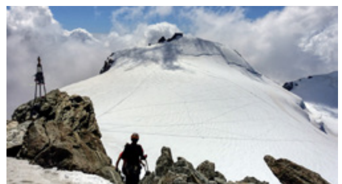
Abstieg von der Zumsteinspitze mit Blick zur Signalkuppe und darauf die Margheritahütte.