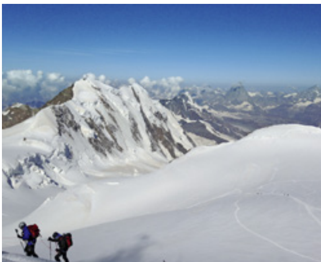
Ankunft auf der Signalkuppe 4554 m, Berge v.l.n.r.: 2x Liskamm 4527 m, Breithorn 4164 m und Matterhorn 4474 m.