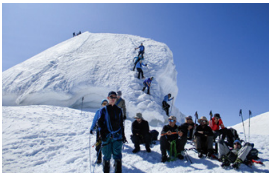
Auf- und Abstieg an der Ludwigshöhe 4321 m.